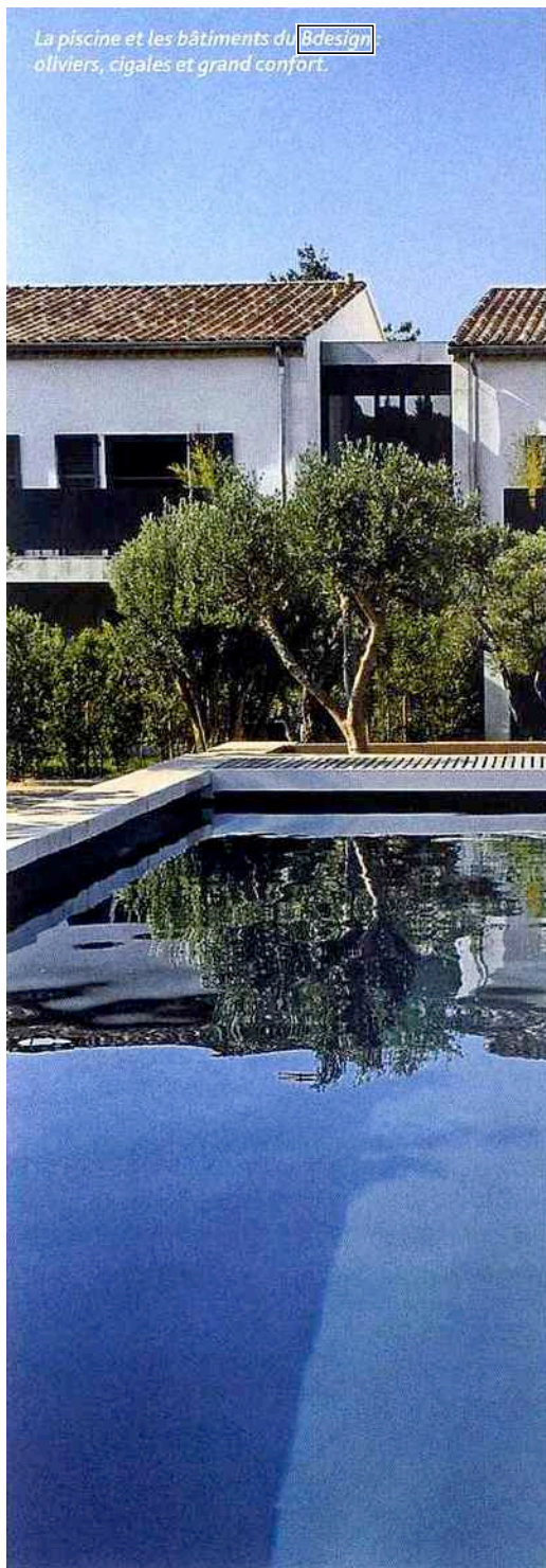
La piscine et les bâtiments du Bdesign : oliviers, cigales et grand confort.