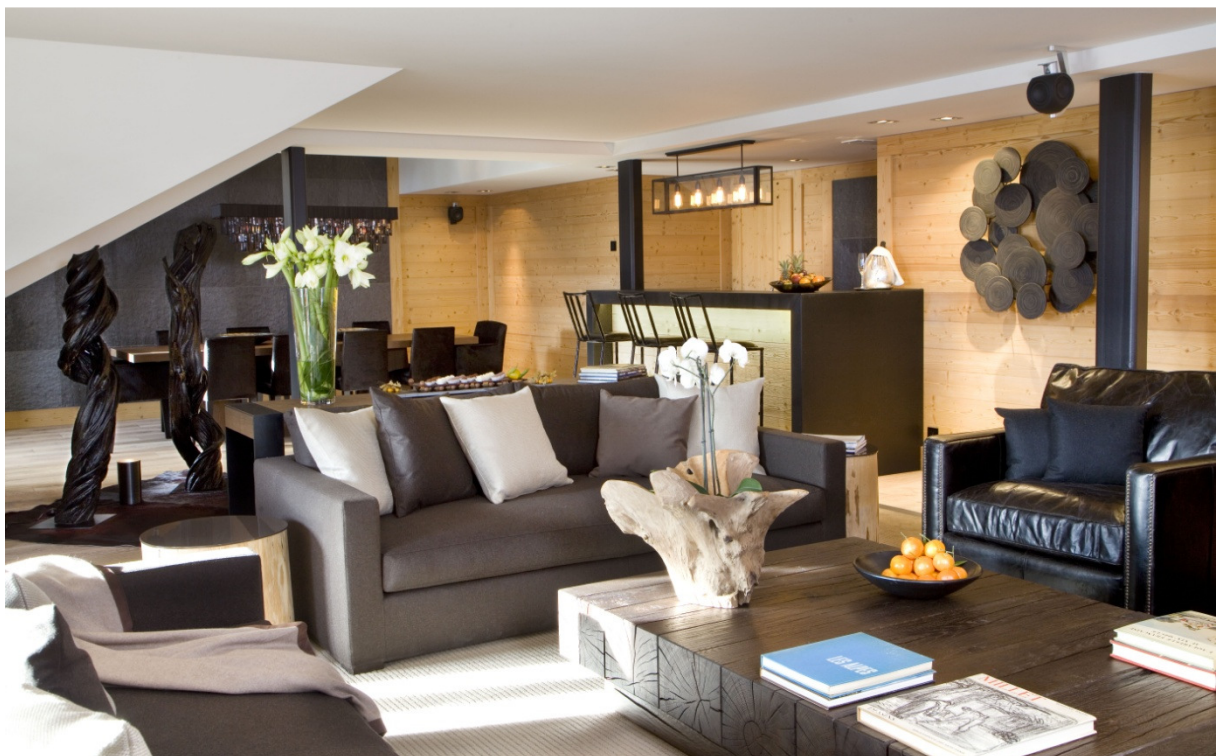
Salon de « My Gstaad Chalet »

L'hôtel compte également 2 de ses chambres entièrement équipées et spécialement adaptées aux besoins de ses clients à mobilité réduite ainsi que 2 chambres conçues pour éviter toute allergie.