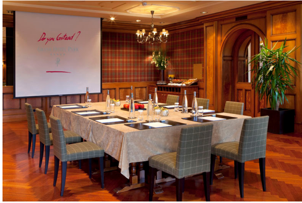
Réunion au salon Montgomery