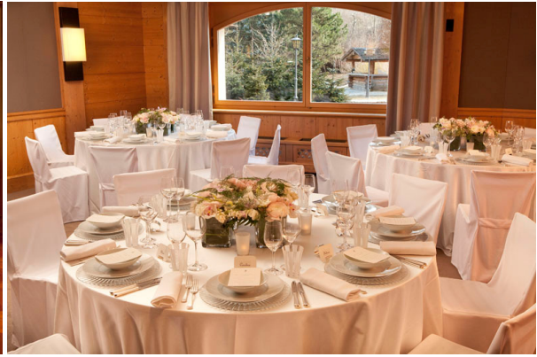
Dîner de mariage au salon Eggli