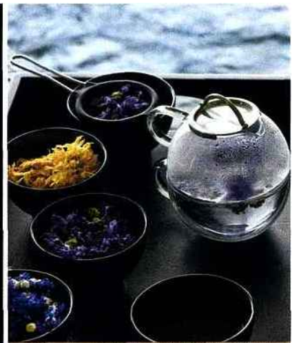
La Grée des Landes Eco Hotel Spa Yves Rocher

www.etangs-corot.com Gommage crushed Carbernet, 35 mn : 80 €. Soins du visage Vinosource, 50 mn : 100 €.