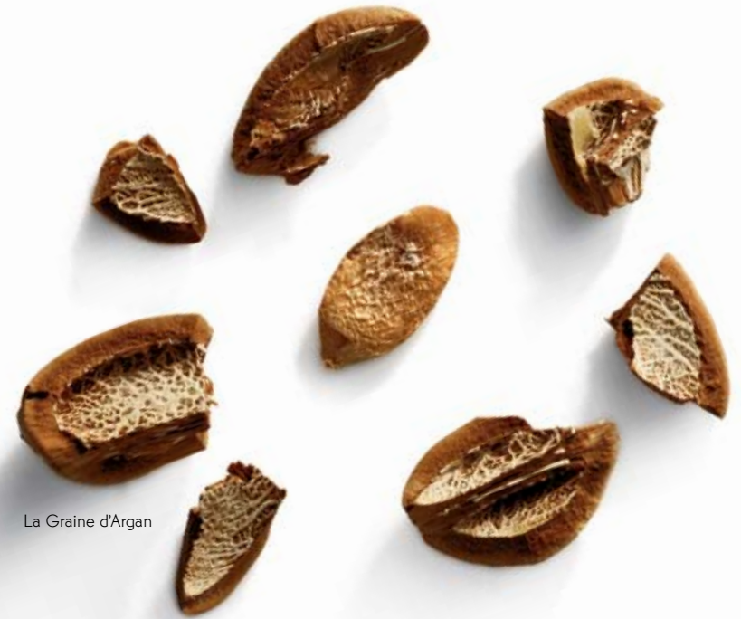
La Graine d'Argan

Une délicieuse tisane Menthe Poivrée est servie pendant le bain de Roses bio. Gommage ensuite à l'aide de noyaux d'Argan. Puis s'ensuit un modelage manuel qui combine l'onctuosité de l'huile d'Argan au parfum de l'huile essentielle de Rose Damascène. Des gestes précis et doux qui lissent et dénouent. Une serviette chaude sur les mains et les pieds pour un retour en douceur à la réalité. Idéal pour s'évader, et retrouver calme et sérénité.