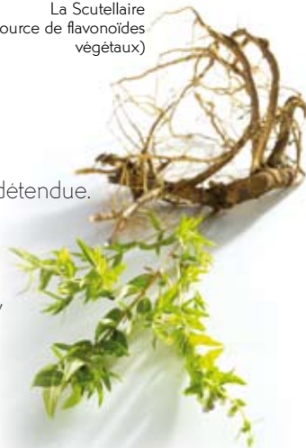
La Scutellaire (source de flavonoïdes végétaux)