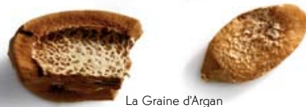
La Graine d'Argan