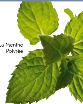
La Menthe Poivrée