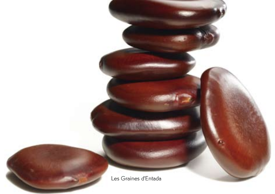
Les Graines d'Entada

L'harmonie s'installe. Relaxation maximale garantie.