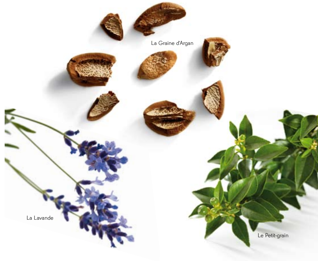
La Graine d'Argan

Idéal pour préparer une cure d'amincissement.