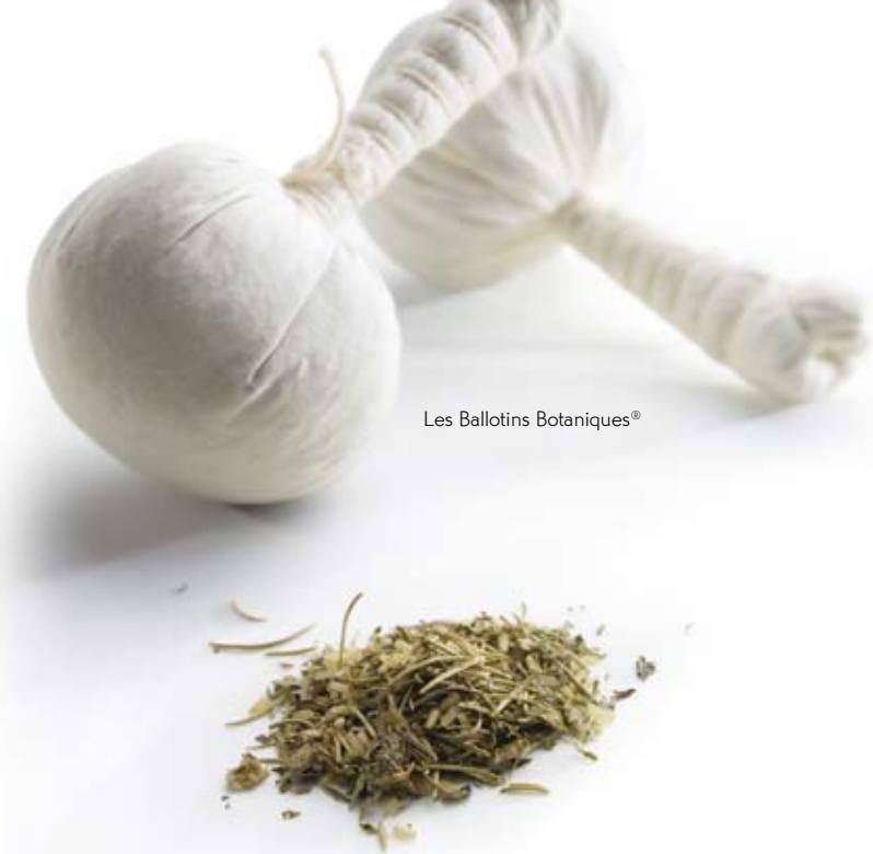
Les Ballotins Botaniques®

Relaxation optimale et sensations multiples au programme pour ce soin qui débute par un bain de fleurs bio et une infusion de plantes. Un gommage à la poudre de fleurs de Tilleul laisse la peau douce et soyeuse. Puis s'ensuit une expérience inoubliable : les Ballotins Botaniques®, chauds et humides, délassent et modèlent l'ensemble du corps. Riches en extraits de plantes, ils lèvent les tensions et donnent l'impression de se réenergiser. Un masque aux eaux de fruits à effet frisson fond sur le visage, procurant fraîcheur et bien-être. Une serviette chaude en touche finale pour vous ramener en douceur à la réalité... De la tête aux pieds, le corps s'apaise et se ressource en profondeur.