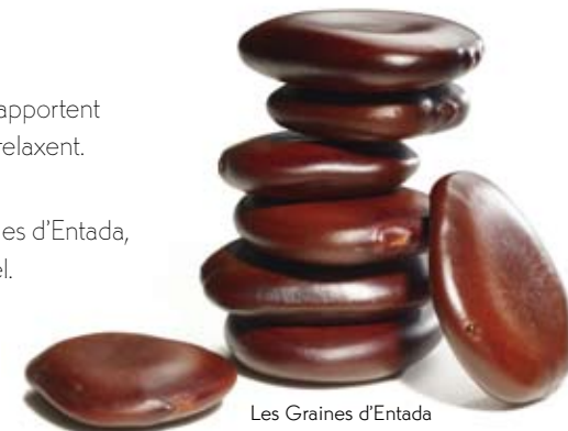
Les Graines d'Entada