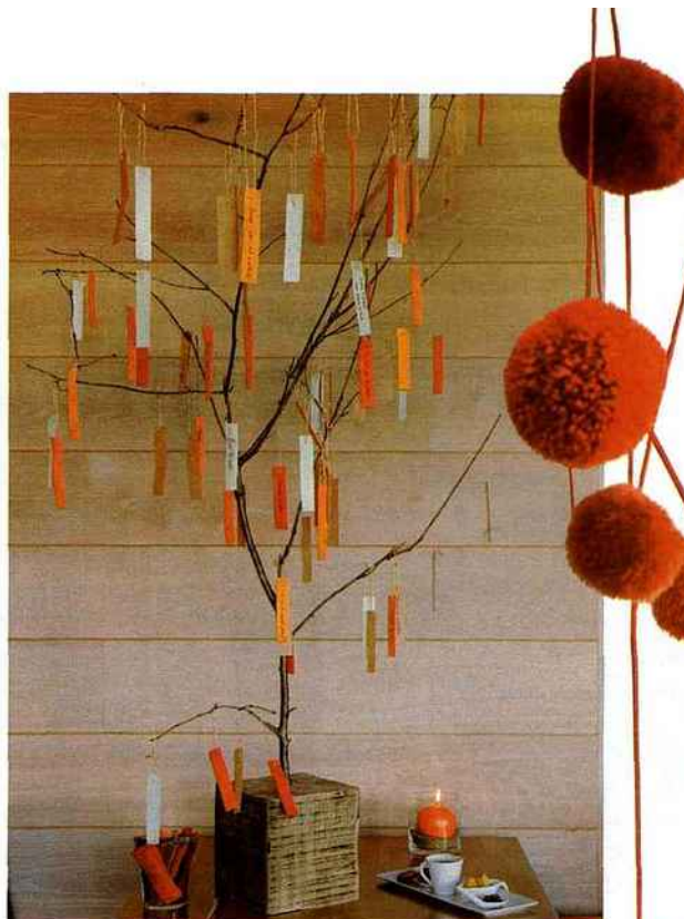
L'ARBRE À SOUHAITS Une belle branche récupérée dans la forêt voisine et plantée dans un socle doré accueillera les vœux pour la nouvelle année.