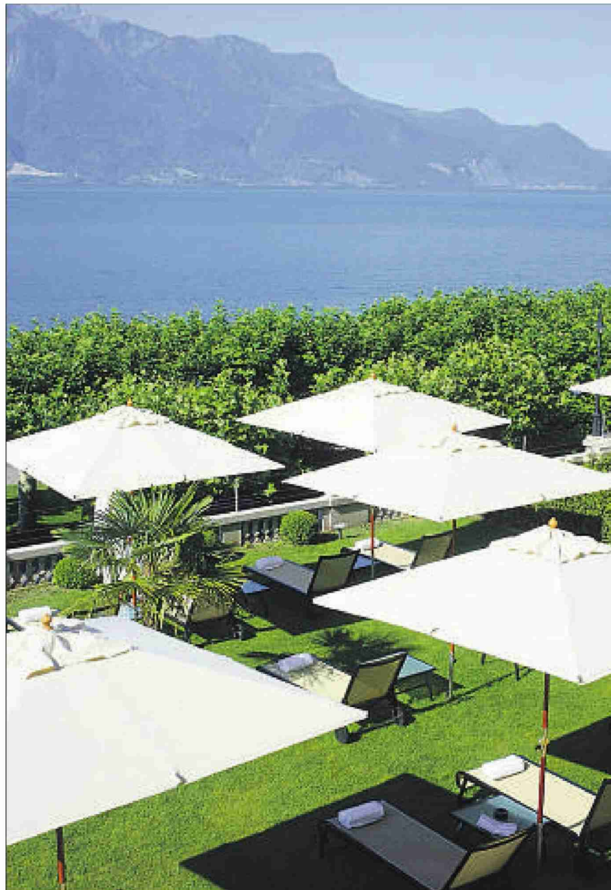
Im «Trois Couronnes» in Vevey kann man von der Terrasse aus die Berge betrachten.

Themen-Nr.: 571.142 Abo-Nr.: 1085375 Seite: 84 Fläche: 167'870 mm 2