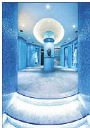
Im «Eden Roc» in Ascona.