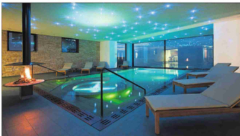
Dem Besucher weisen im Hotel Bad Horn, wie einst Christoph Kolumbus, die Sterne den Weg über den grossen Teich.